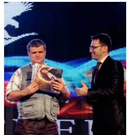
Lansare catalog Braille