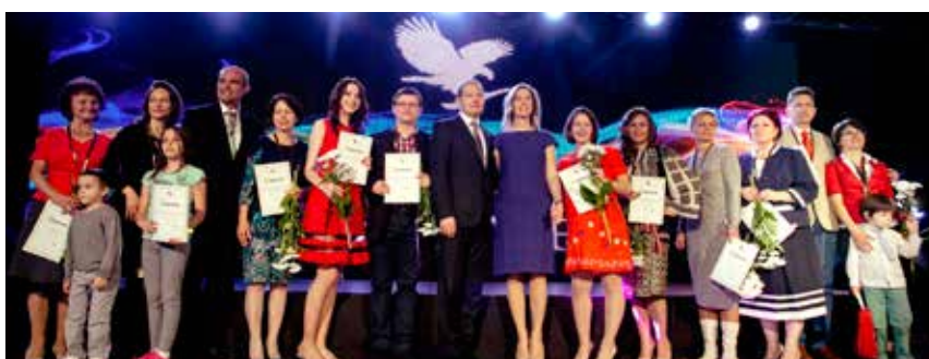
Calificări Asistent Manageri