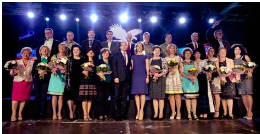
Recunoașteri Key Leaders' Council