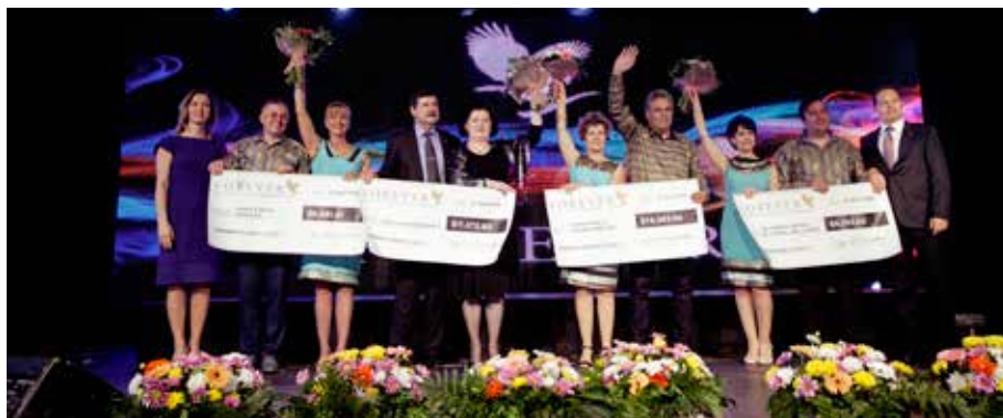
Recunoașteri Chairman's Bonus