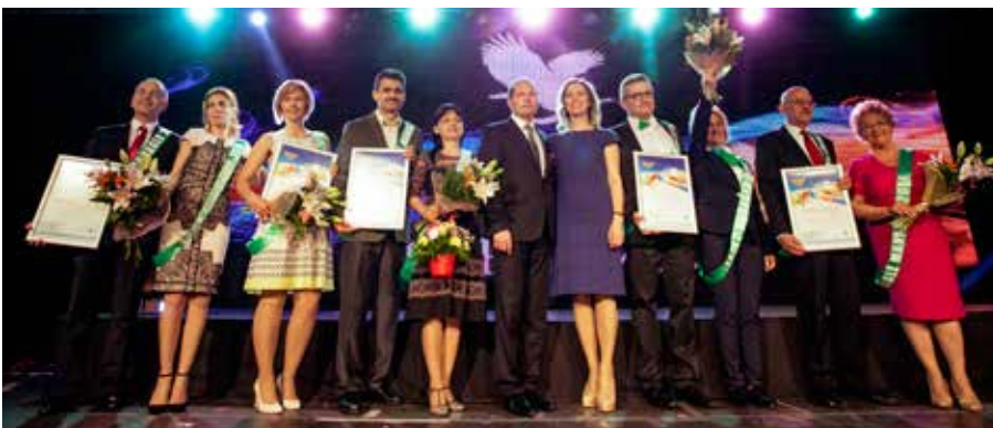
Calificări Eagle Manager